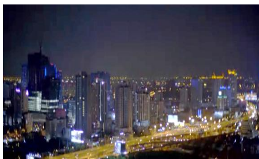
ภาพที่ 5 ทางด่วน

2.1 การเดินทางด้วยรถยนต์ส่วนตัวในละครซีรีส์เรื่องนี้ ตอน รักมาก โกรธมาก ได้นำเสนอถึงเส้นทางการคมนาคมบนทางด่วนในกรุงเทพมหานคร ดังภาพที่ 5