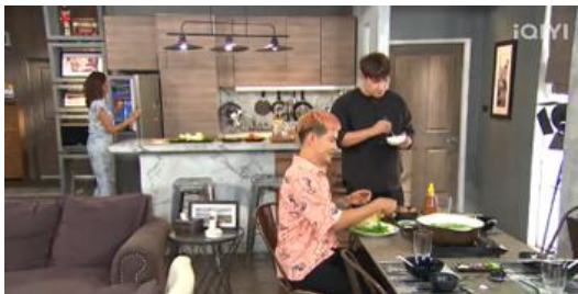
ภาพที่ 2 ห้องครัวแบบสไตล์ตะวันตก