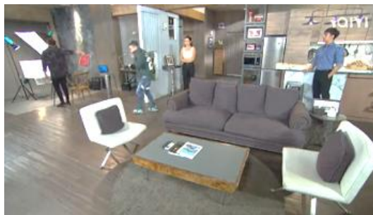
ภาพที่ 1 ลักษณะห้องชุดของตัมกับชาตรี

ได้นำเสนอที่อยู่อาศัยของตัวละครเป็นห้องชุดในคอนโดมิเนียมของตัมกับชาตรี และห้องชุดของเอ็งเอยในตอน คอลเลกชันใหม่ คอลเลกชันเก่า ห้องชุดของออย ในตอน ชะนี VS แม่ผัว ดังภาพที่ 1