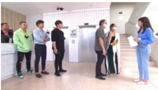
ภาพที่ 3 ห้องโถงในคอนโดมิเนียมและลิฟท์

1.3 สิ่งอำนวยความสะดวกในที่อยู่อาศัย สิ่งอำนวยความสะดวก คือ คุณประโยชน์ต่าง ๆ จากตัวอสังหาริมทรัพย์ ทั้งในส่วนที่เห็นเป็นตัวตนจับต้องได้และที่มองไม่เห็นเป็นตัวตน โดยคุณประโยชน์ต่าง ๆ เหล่านี้เป็นปัจจัยสำคัญที่ทำให้ที่อยู่อาศัยมีมูลค่าสูงขึ้นได้ เช่น ห้องรับแขกที่สวยงาม ลิฟต์ บริการต่าง ๆ และที่จอดรถเป็นต้น (home market, 2560) ในละครซีรีส์เรื่องนี้ ตอน กระดุมเม็ดใหม่ ได้นำเสนอสิ่งอำนวยความสะดวกในที่พักของคนในสังคมเมือง อย่างเช่น ลิฟต์ พื้นที่ล๊อบบี้ ระบบความปลอดภัย กล้องวงจรปิด เป็นต้น ดังภาพที่ 3