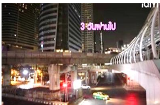
ภาพที่ 6 เส้นทางรถไฟฟ้า และเส้นทางสกายวอล์คและสะพานลอยคนข้าม

2.2 การเดินทางด้วยบริการสาธารณะ ในละครซีรีส์เรื่องนี้ ตอน คอลเลคชั่นใหม่ คอลเลคชั่นเก่า ได้นำเสนอถึงภาพการคมนาคมในใจกลางเมืองกรุงเทพมหานคร ได้แก่ เส้นทางสกายวอล์คและสะพานลอยคนข้าม ทางรถไฟฟ้า และรถแท็กซี่ที่วิ่งสัญจรรับผู้โดยสารอยู่บนท้องถนน ดังภาพที่ 6