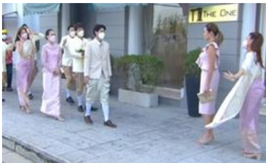
ภาพที่ 7 การแต่งกายในพิธีสู่ขอเจ้าสาว

4.1 การแต่งกายที่มีการผสมผสานทางวัฒนธรรม ในละครซีรีส์เรื่องนี้ ตอน เราและนาย...ตลอดไป ได้นำเสนอภาพงานพิธีการสู่ขอของลูกบอยที่มีการแต่งกายแบบการผสมผสานทางวัฒนธรรม โดยลีนุงผ้าโจงกระเบนแบบไทยและใส่สูทแบบตะวันตก ส่วนออยแต่งกายตามแฟชั่นทันสมัย ในขณะที่แม่ของลีและเพื่อน ๆ ของออยใส่ชุดไทย ดังภาพที่ 7